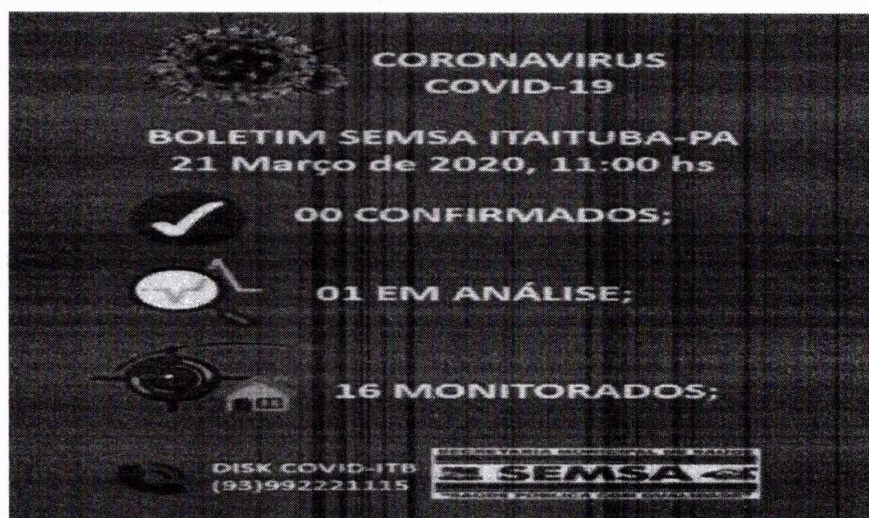
Figura 1: DADOS INICIAIS

A doença atual apresenta características desafiadoras: a alta capacidade de disseminação faz com que, aparentemente, uma pessoa infectada transmita o vírus para outras duas ou três. Dentro de um intervalo de seis ou sete dias os casos tendem a dobrar. Com a emergência da COVID-19 causada pelo novo Coronavírus, toda a comunidade científica passou a correr contra o tempo na busca de medicamentos que sejam eficazes no tratamento da doença. Os medicamentos a serem adquiridos visam garantir a assistência farmacêutica acerca da ampliação ao acesso a medicamento aos pacientes infectados por COVID-19. Ressalta-se que os medicamentos devem ser administrados a critérios médicos e que essa aquisição de medicamentos dará suporte inicial para o enfrentamento desta pandemia que assola o mundo, impactando também o município de Itaituba, conforme dados abaixo.